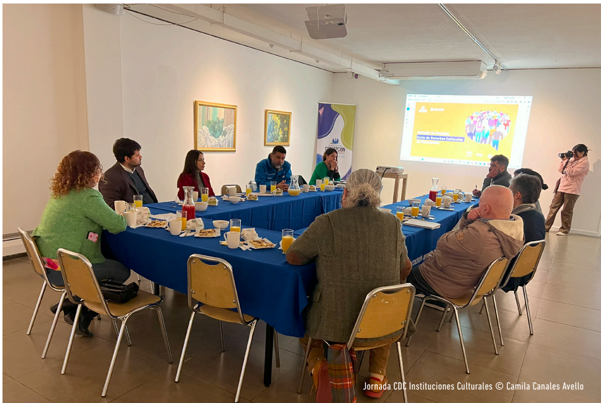
Jornada CDC Instituciones Culturales