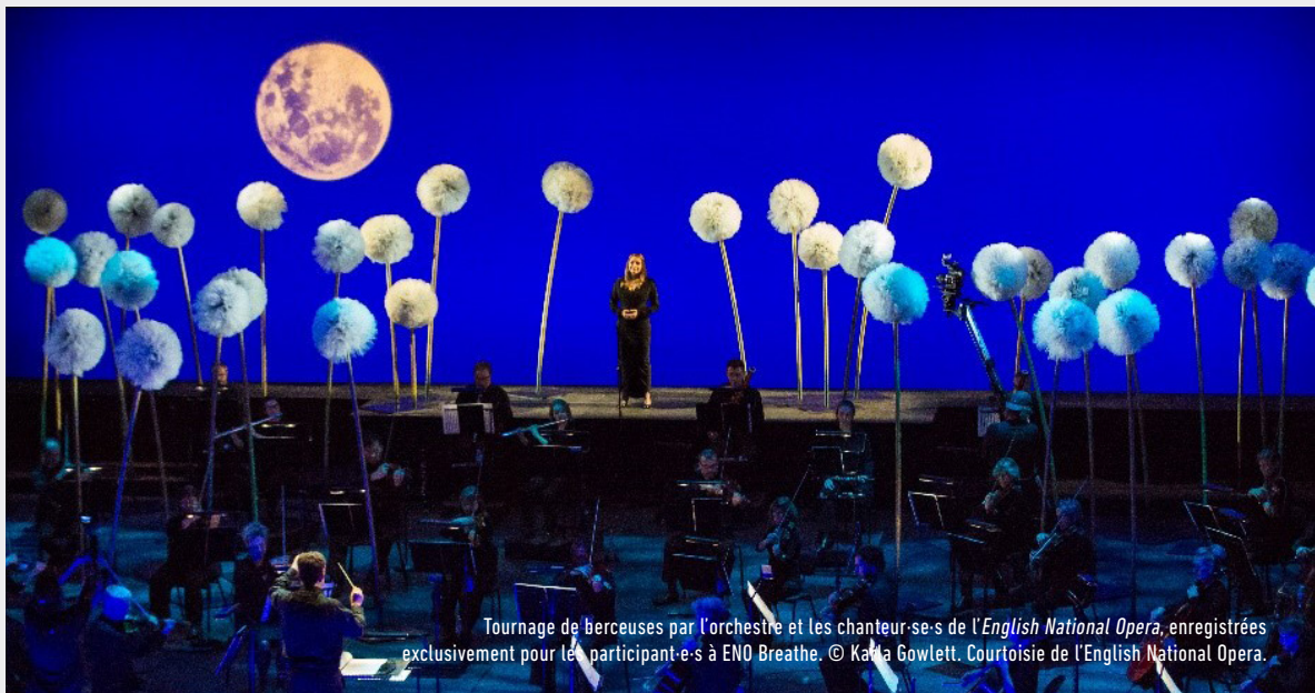
Tournage de berceuses par l'orchestre et les chanteur-se-s de l'English National Opera, enregistrées exclusivement pour les participant-e-s à ENO Breathe.