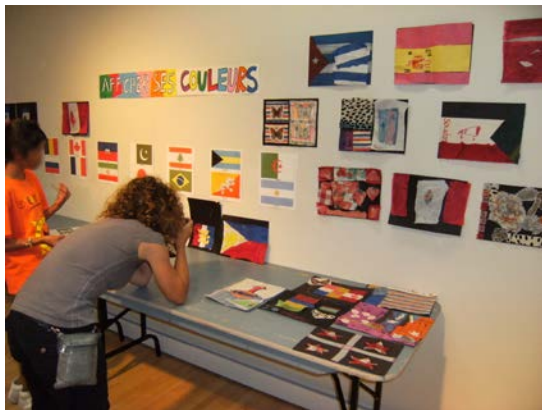
© Anne-Marie Beaulieu, Casa de la cultura Costa de las Nieves, Ciudad de Montreal