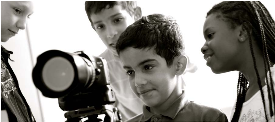
© Daphné Cyr, Festival del nuevo cine